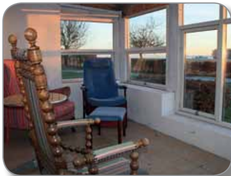
Dejlige udestue med udsigt til vandet.

net for hhv. 5 og 6 personer, men kan med lidt "god vilje" rumme mange flere overnattende.