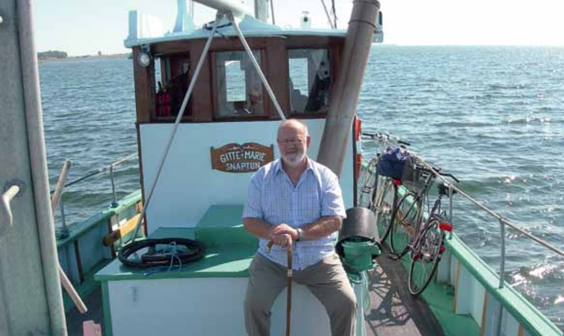
Den gamle fiskekutter "Gitte Marie" sejler gående og cyklister til Alrø og Snaptun.