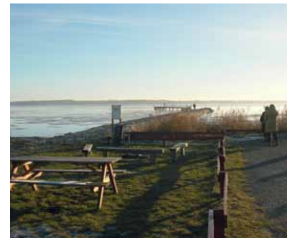
Der er grill, bænke og toilet ved molen.

Den gamle stenmole blev nedlagt efter skibskatastrofen den 15.1. 1944, hvor fragt- og passagerdamperen S/S Agda eksploderede efter påsejling af en mine. Minen var efter sigende smidt ud fra et engelsk fly, der havde brug for at mindske sin last, fordi det blev jagtet af tyskere. 10 passagerer, fire besætningsmedlemmer og en hest døde i det man kaldte "Den største skibskatastrofe i dansk indenrigs skibsfart under krigen". Agda sejlede på ruten mellem Endelave, Alrø, Hjarnø, Snaptun og Horsens. På museet på Endelave er der en udstilling om ulykken.