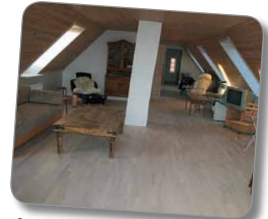
Der er plads til 6 personer i 1. sals lejligheden, hvortil der hører altan med god udsigt.