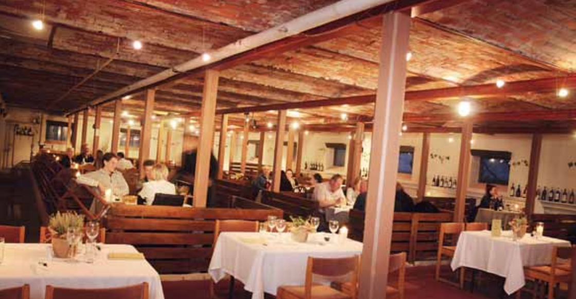
De gamle grisebåse opdeler restauranten på en fin måde.