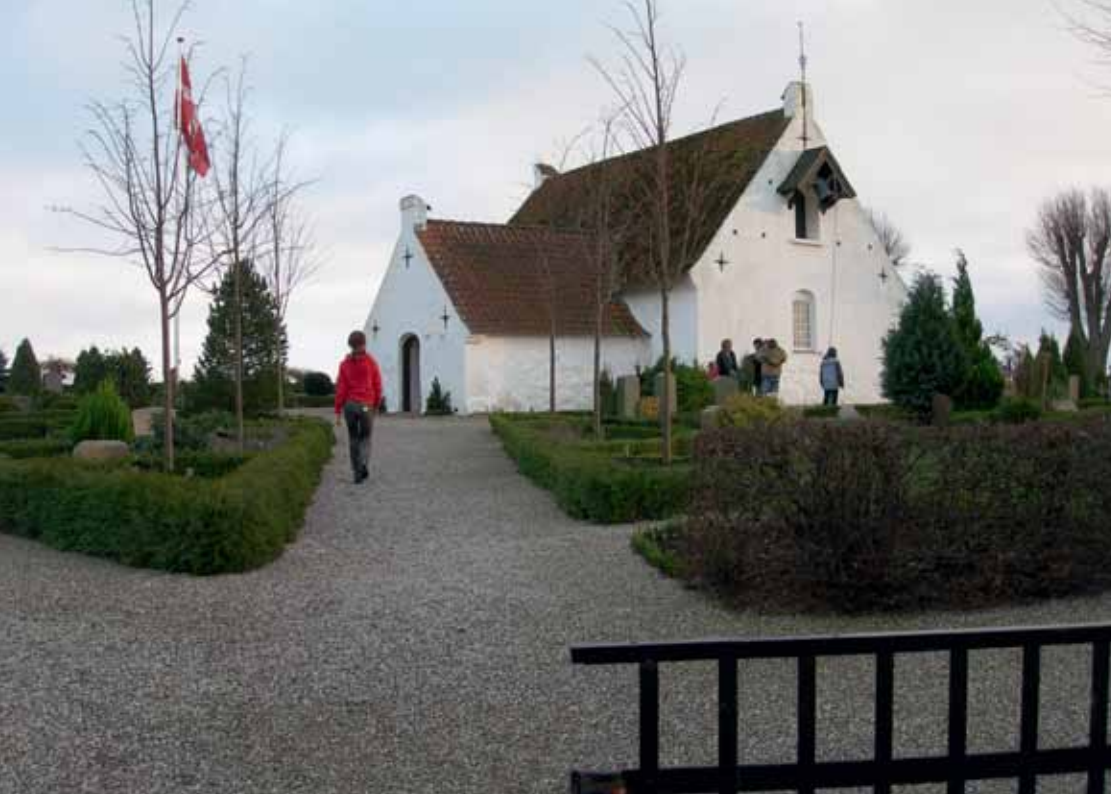
I tidens løb har mange takket klokken på Alrø for deres liv. Når tågen overraskede folk på isen – eller i båd – gelejdede aftenringningen de vildfarne i retning mod land.