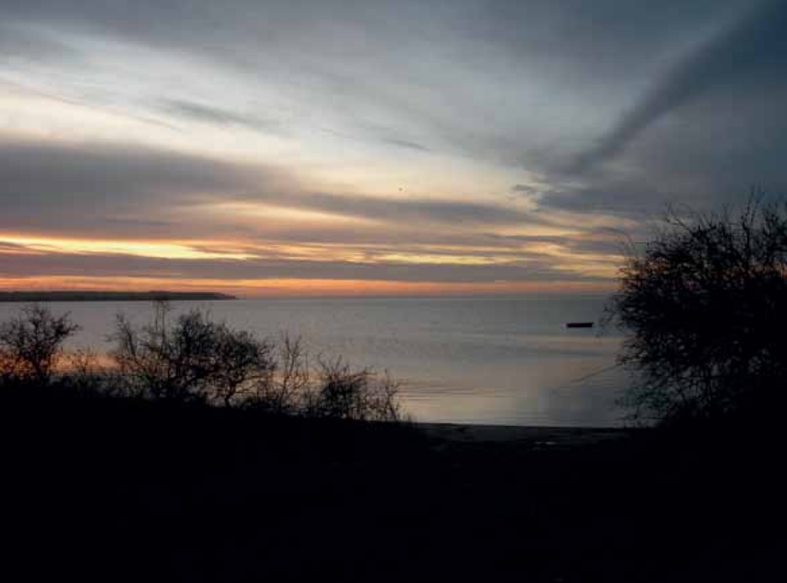
Solopgang ved dæmningen med udsigt til vadegrunden og Gyllingnæs.