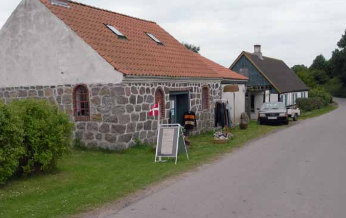
Bindingsværkshuset ved den gamle bysmedie er et af lejemålene i Alrø Feriebolig.